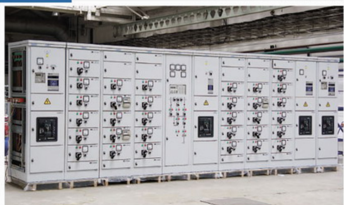
Распредустройство 0,4 кВ для экспортного газопровода.

способным перестраиваться на серийный выпуск того или иного вида продукции за считанные недели. Многие соискатели вакантной должности ищут на нашем предприятии стабильности, понимая под этим размеренный темп работы и годами неизменяемые производственные процессы. Их ожидает отказ, поскольку наше предприятие живет в постоянном движении. Стабильность жизни ОАО "НИПОМ" в постоянном развитии и наращивании взаимосвязанных процессов производства. Мы - люди очень активные, не пропускаем анонсы и