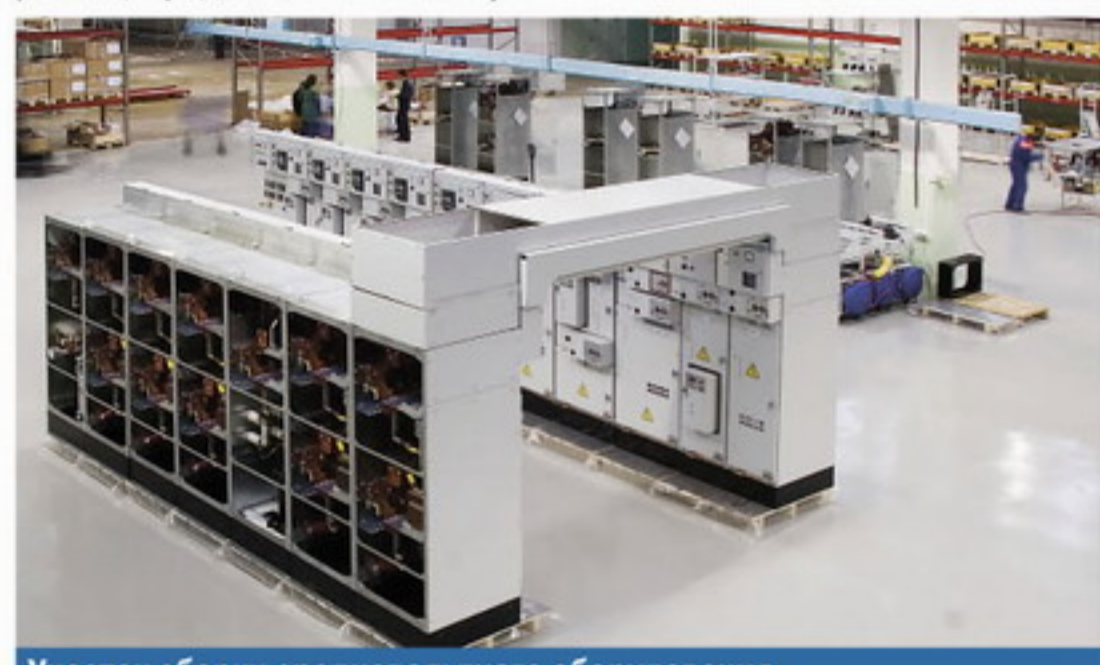
Участок сборки средневольтного оборудования.

Предприятие не останавливается на достигнутом. В декабре 2007 года подписано лицензионное соглашение с одним из крупнейших производителей электрощитового оборудования в Европе - компанией Logstrup. Начало выпуска первых щитов ОАО "НИПОМ" на базе Logstrup - апрель 2008 года. Это позволяет ОАО "НИПОМ" производить оборудование, удовлетворяющее специальным требованиям атомной промышленности, требованиям морского судостроения. Новое производство дает возможность участвовать в самых ответственных проектах развития России: освоение шельфа и строительство плавучих атомных энергоустановок.